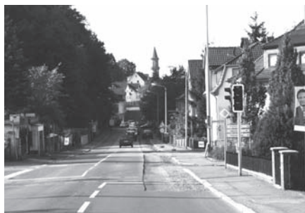
Während der Baumaßnahmen an der Sonneberger Straße wurde der Verkehr über eine Baustellenampel geregelt.

In der Woche vom 23. bis 27. November 2009 wurde das Teilstück der Sonneberger Straße im Bereich Altenheim/Betreutes Wohnen mit einer neuen Asphaltdeckschicht überzogen. Durch umfangreiche Aufgrabungen der Stadtwerke und sonstige Fahrbahnschäden war dies dringend notwendig geworden. Im Jahr 2010 werden die Stadtwerke im Abschnitt bis zum Stadion Versorgungsleitungen auswechseln. Da die Fahrbahndecke hier ebenfalls sehr schlecht ist, wird dieser Bereich in diesem Jahr ebenfalls erneuert.