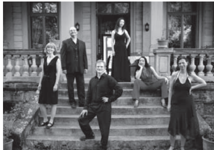
Die Besucher des Rathauskonzertes am 27.2.2010 können sich also auf das Ensemble „TANGUEDON“ freuen.