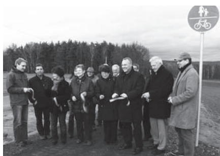
Der Bausenat und der Verkehrssenat eröffneten am 18. November 2009 gemeinsam das neue Teilstück des Radwegs am Ortsausgang Ketschenbach.

Mitte November 2009 wurde eine weitere Lücke im Radwegenetz der Stadt Neustadt b. Coburg geschlossen. Durch die Freigabe des 400 Meter langen Teilstückes vom Friedhof Ketschenbach Richtung Meilschnitz/Wildenheid ist es nun möglich, abseits der engen und für Fußgänger und Radfahrer gefährlichen Straße von Ketschenbach zum Radweg an der Eisfelder Straße zu gelangen.